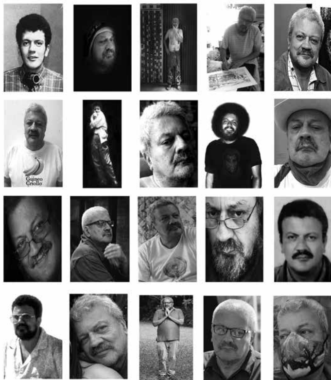
Quirval: Alter Egos 2021, Foto performance digital.