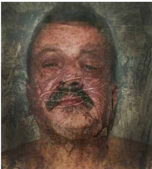
Quirval: Alter Egos 2021, Foto performance digital.