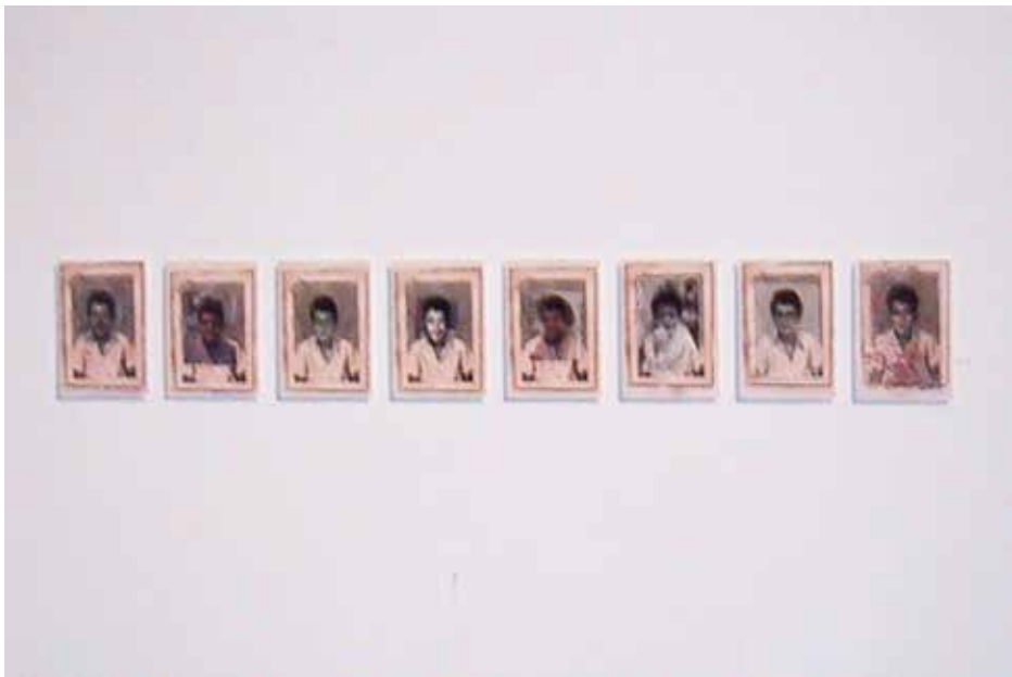
Quirval: Autorretrato. 1999. Fotografía digital.