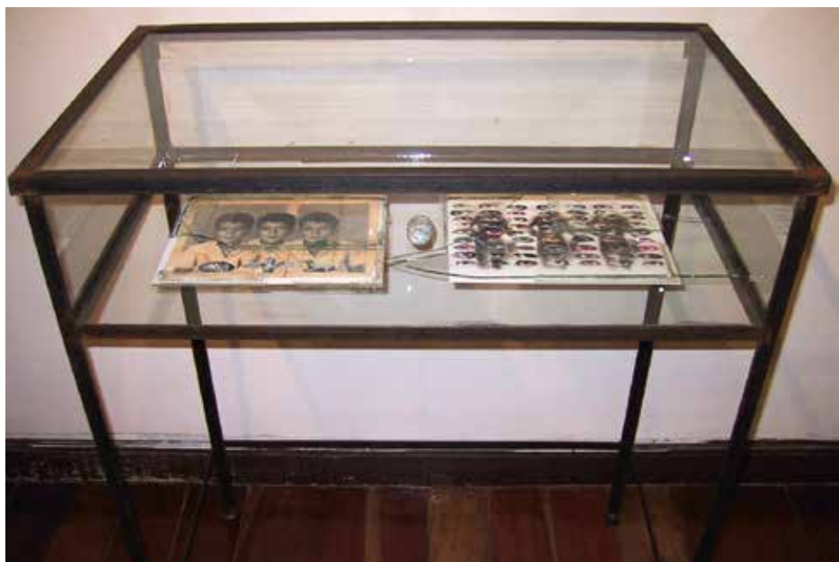
Quirval: Autorretrato. 1999. Fotografía digital.