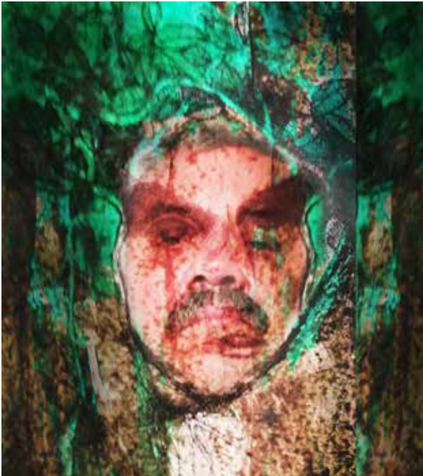
Quirval: Alter Egos 2021, Foto performance digital.