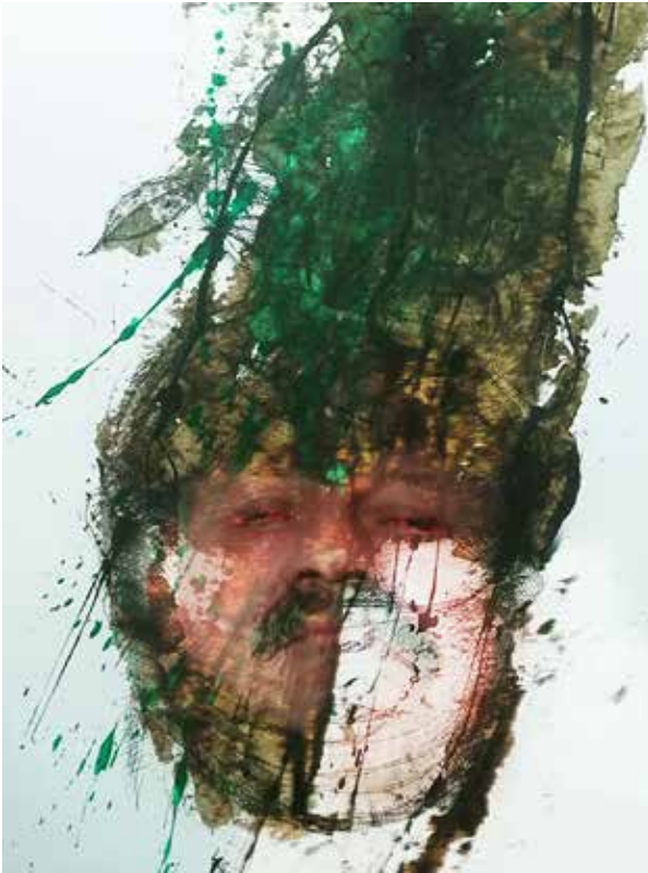
Quirval: Alter Egos 2021, Foto performance digital.