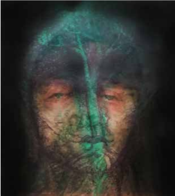
Quirval: Alter Egos 2021, Foto performance digital.