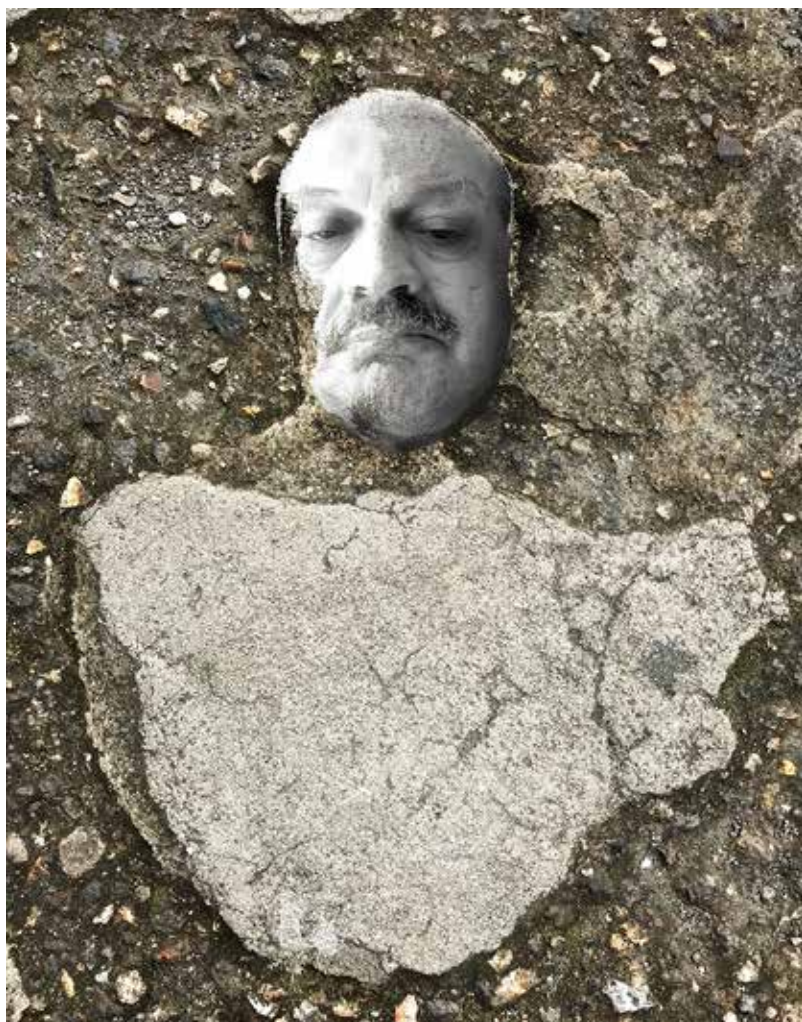
Quirval: Alter Egos 2021, Foto performance digital.