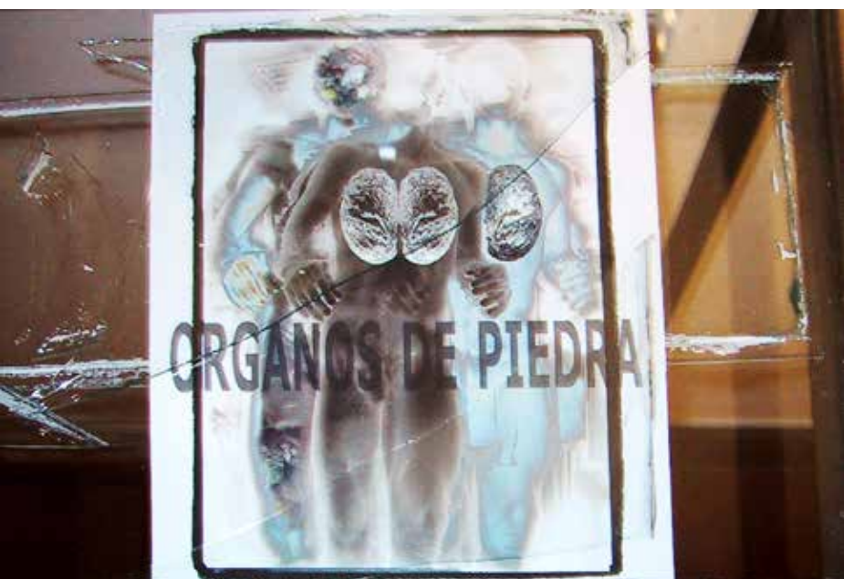
Quirval: Autorretrato. 1999. Fotografía digital.