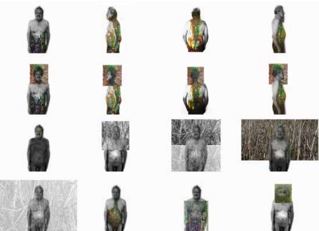
Quirval: Alter Egos 2021, Foto performance digital.