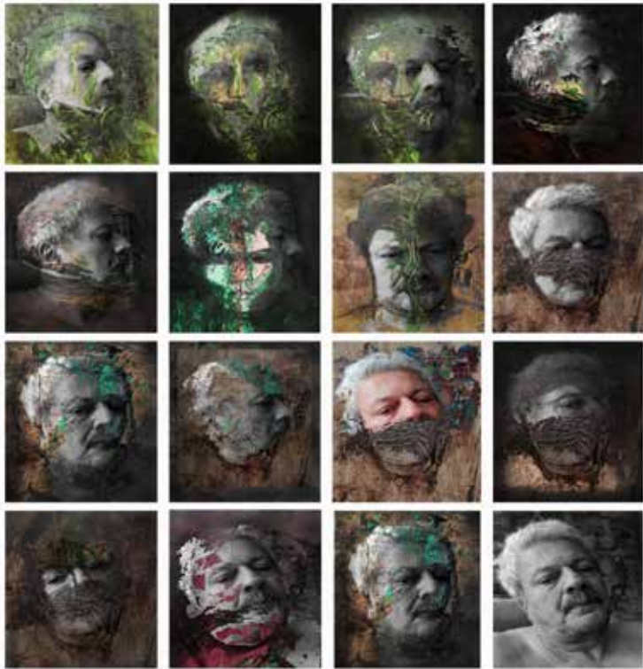
Quirval: Alter Egos 2021, Foto performance digital.