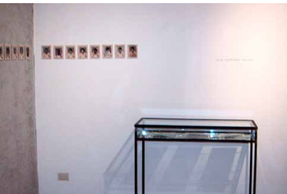
Quirval: Autorretrato. 1999. Fotografía digital.