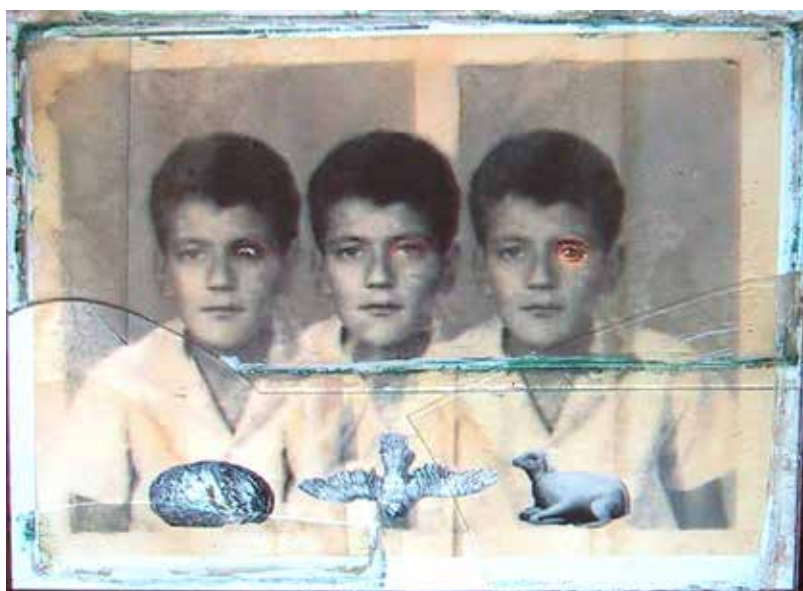
Quirval: Autorretrato. 1999. Fotografía digital.