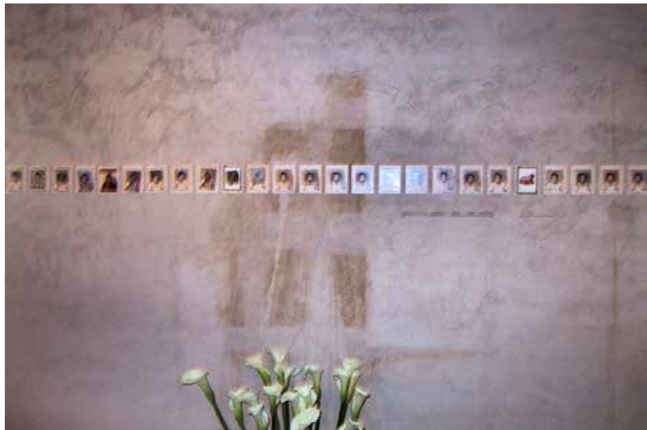
Quirval: Autorretrato. 1999. Fotografía digital.