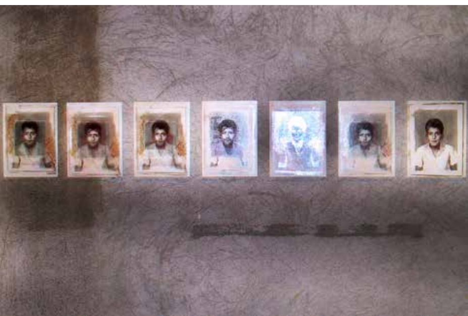
Quirval: Autorretrato. 1999. Fotografía digital.