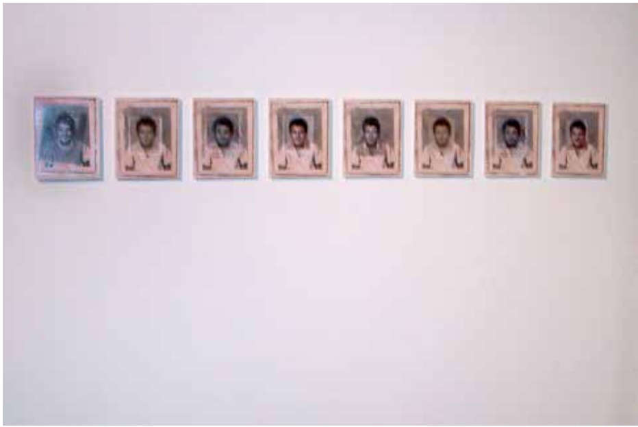
Quirval: Autorretrato. 1999. Fotografía digital.