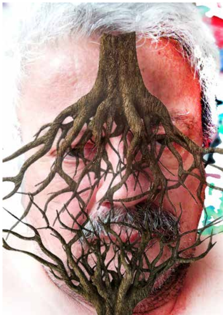
Quirval: Alter Egos 2021, Foto performance digital.