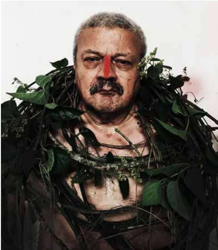
Quirval: Alter Egos 2021, Foto performance digital.