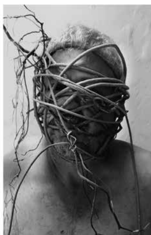
Quirval: Alter Egos 2021, Foto performance digital.