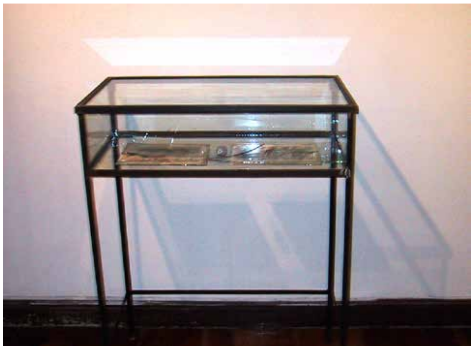
Quirval: Autorretrato. 1999. Fotografía digital.