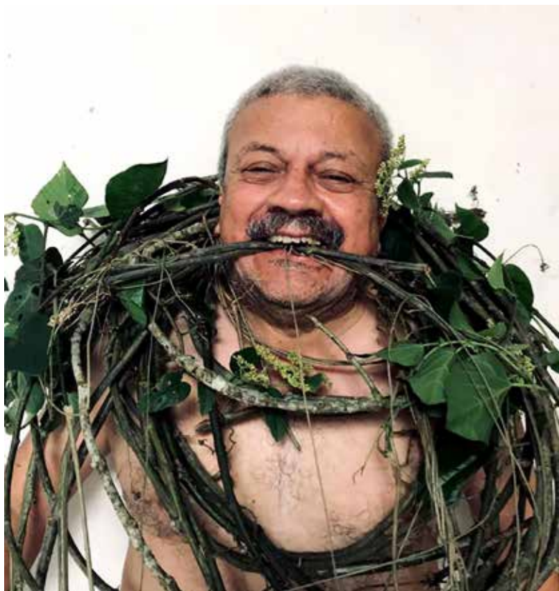
Quirval: Alter Egos 2021, Foto performance digital.