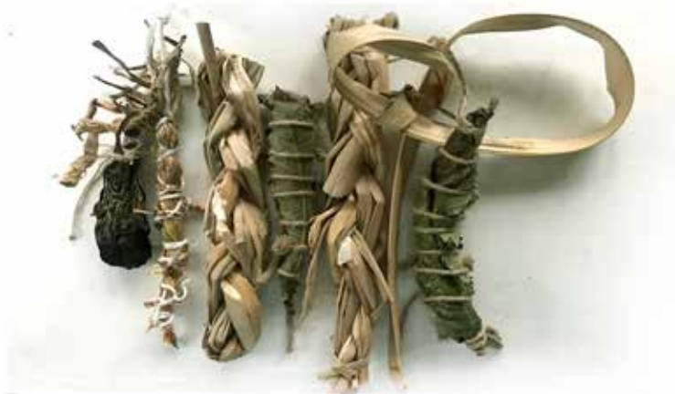
Quirval: Alter Egos 2021, Foto performance digital.