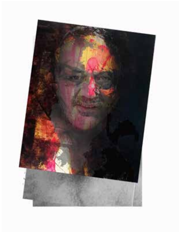
Quirval: Alter Egos 2021, Foto performance digital.