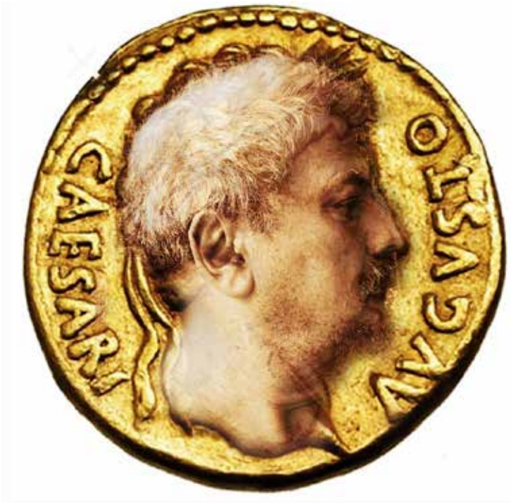
Quirval: Alter Egos 2021, Foto digital.