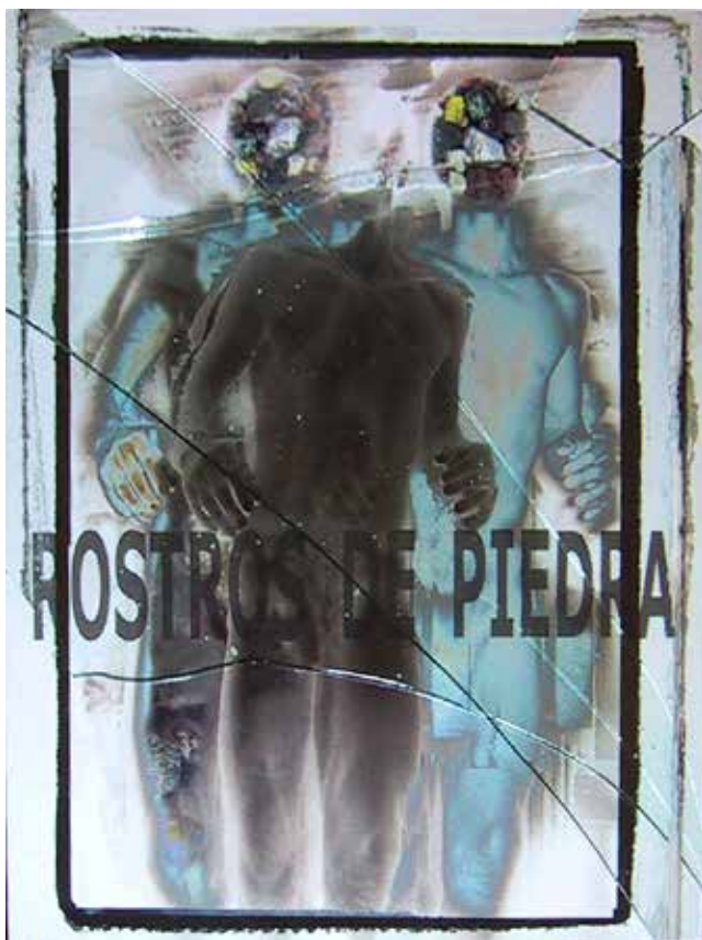
Quirval: Autorretrato. 1999. Fotografía digital.