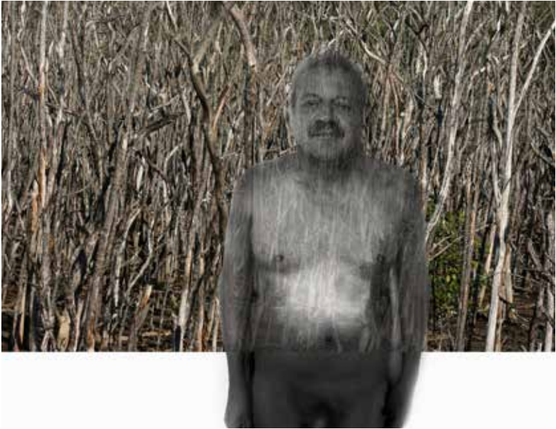
Quirval: Alter Egos 2021, Foto digital.