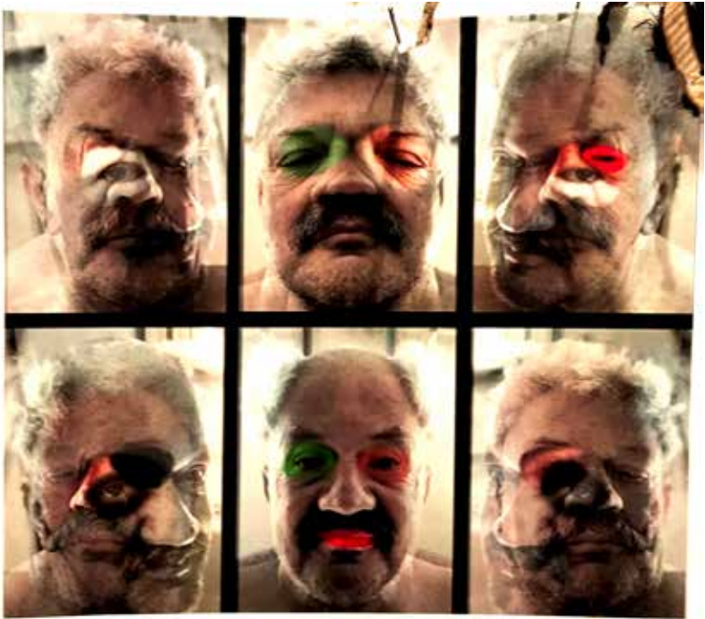
Quirval: Alter Egos 2021, Foto performance digital.