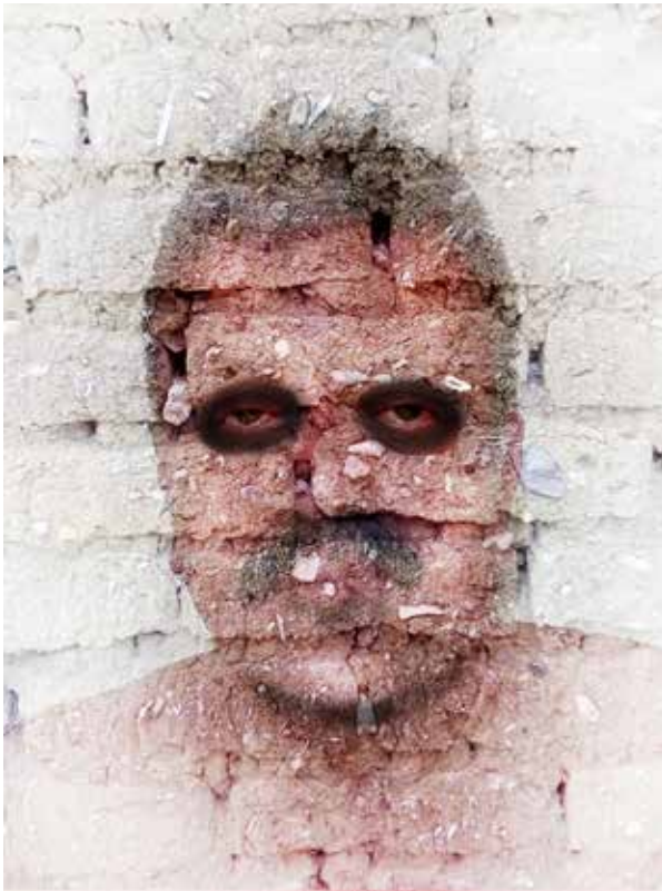
Quirval: Alter Egos 2021, Foto performance digital.