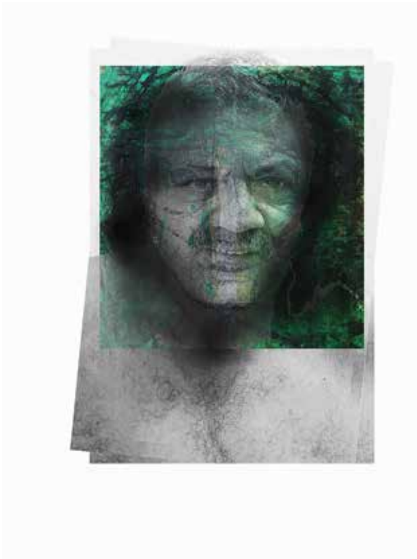
Quirval: Alter Egos 2021, Foto performance digital.