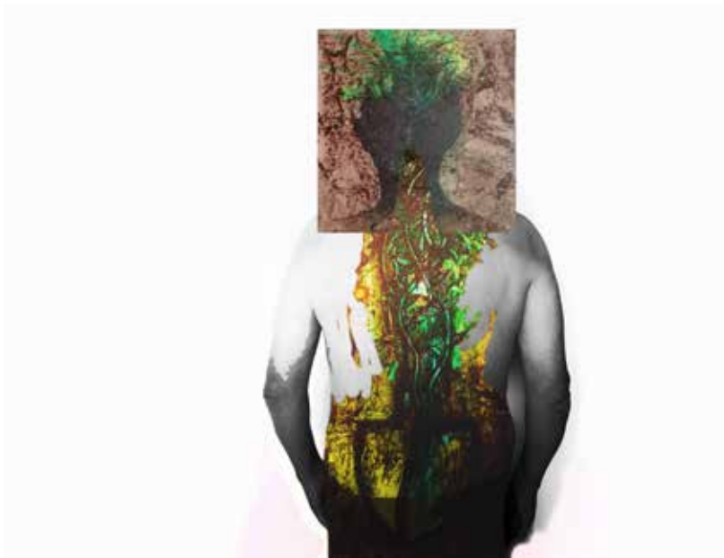
18 Quirval: Alter Egos 2021, Foto digital.