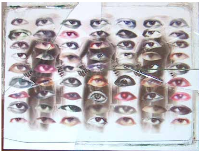
Quirval: Autorretrato. 1999. Fotografía digital.