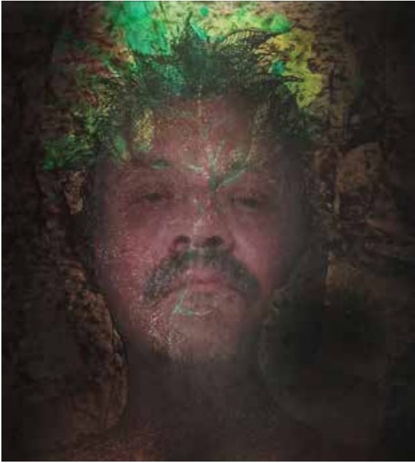
Quirval: Alter Egos 2021, Foto performance digital.