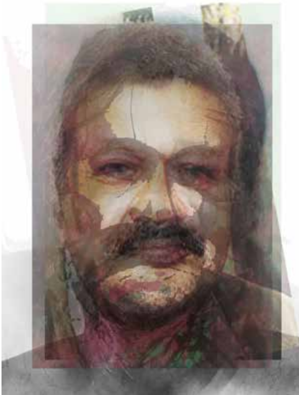
Quirval: Alter Egos 2021, Foto performance digital.