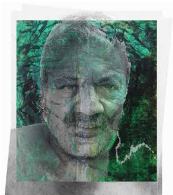
Quirval: Alter Egos 2021, Foto performance digital.